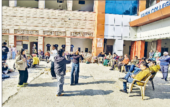
रोहताक। मकर संक्रांति पर्व पर नृत्य करते विद्यार्थी।