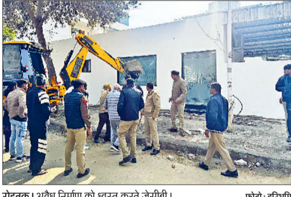
रोहतक। अवैध निर्माण को ध्वस्त करते जेसीबी।

रोहतक। एमडीयू के खेल परिसर में उत्तर क्षेत्रीय अंतर विश्वविद्यालय महिला टेनिस टूर्नामेंट के अंतिम चरण के मुकाबले बुधवार को खेले गए, जिनमें दिल्ली विवि ने सीसीएसयू मेरठ को 2-0 से और पंजाब विवि चंडीगढ़ ने एमडीयू यूनिवर्सिटी को 2-0 से हराते हुए फाइनल में जगह बनाई। फाइनल मुकाबला 15 जनवरी को पंजाब विश्वविद्यालय चंडीगढ़ और दिल्ली विश्वविद्यालय के बीच खेला जाएगा।