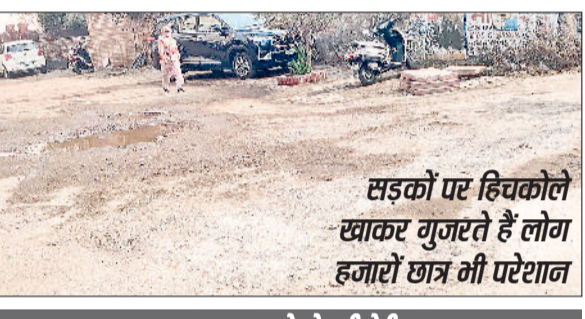
सड़कों पर हिचकोले खाकर गुजरते हैं लोग हजारों छत्र भी परेशान

हरियाणा राज्य सरकार द्वारा लॉन्च किए गए म्हारी सड़क ऐप पर रोजाना 10 से 15 शिकायतें दर्ज की जा रही हैं। यह ऐप हरियाणा के