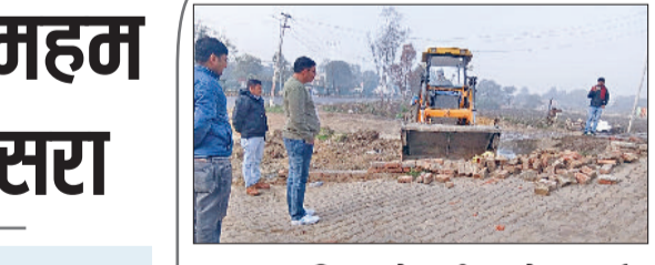
नगर पालिका ने शहीद मुकेश पार्क के पास से हटाया अतिक्रमण